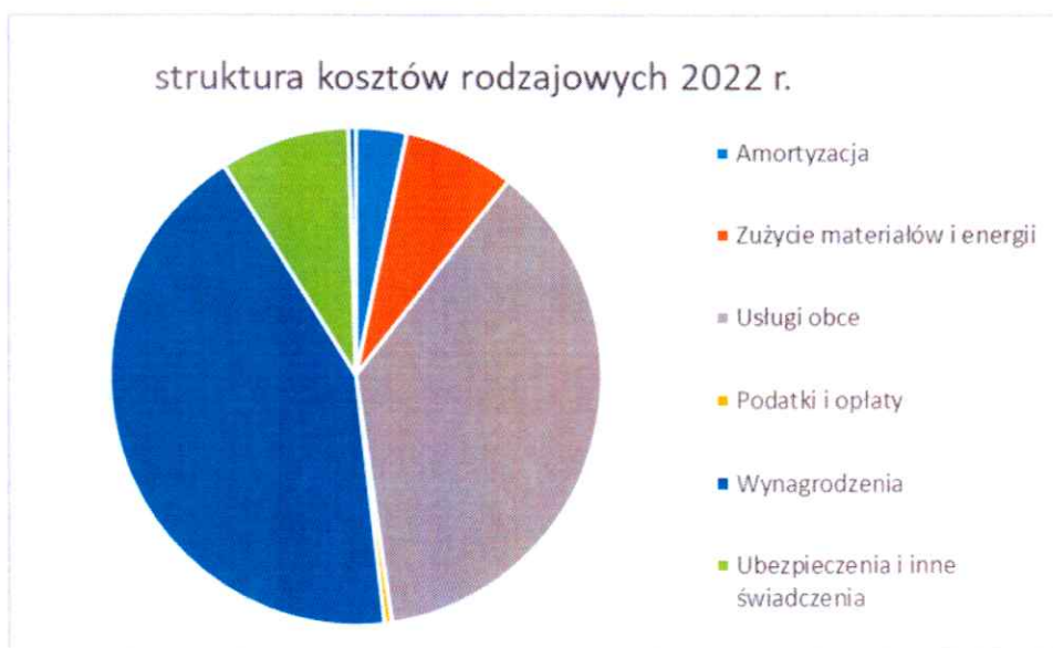
Wykres nr 3